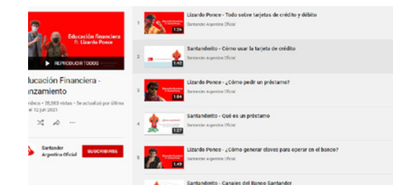
CAMPAÑA DE LANZAMIENTO

Para visibilizar todas estas acciones, se implementó una campaña de comunicación en redes con un influencer local.